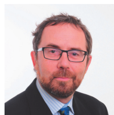
Moderation: Christian Brändli Chefredaktor Z0 Medien